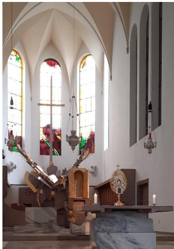
Heilig-Kreuz in Augsburg, Foto: Ralf Gössl

Vergelt's Gott für Ihre Mitfeier der Gottesdienste und für Ihr Gebet!